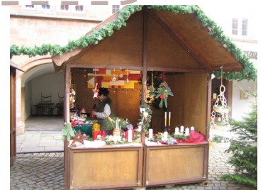
Hütte beim Bürgerweihnachtsmarkt

„Verkaufsoffener Sonntag dieses Jahr zu Kläschen- sonntag“