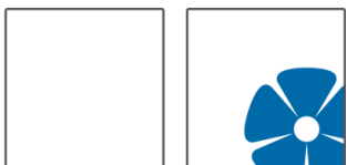
Alte Hansestadt Lemgo

Dank an alle Sponsoren und ehrenamtlich Tätigen!