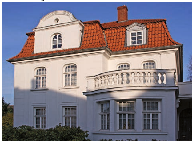
Das ehemalige Wohnhaus der Familie Kabaker.