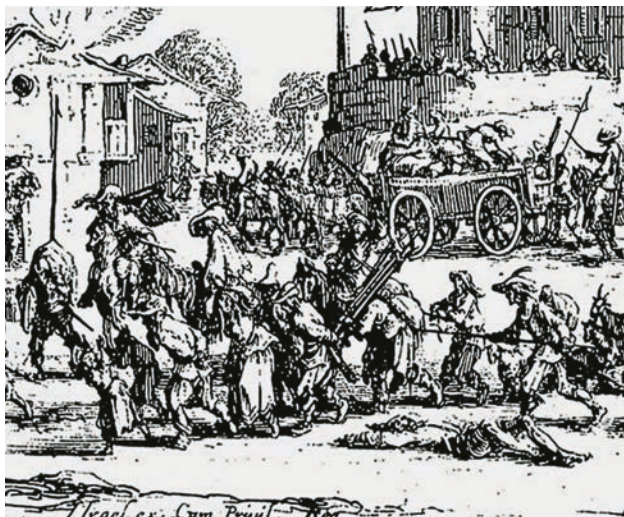
Illustration des Dreißigjährigen Krieges.